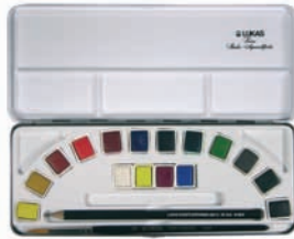
LUKAS AQUARELL STUDIO Metallkasten mit 16 halben Näpfchen (Art.-Nr. 6739)

Farben: Für den einfachen Start bietet sich ein LUKAS AQUARELL STUDIO Künstler-Malkasten an: Darin können die Aquarellnäpfchen gut geschützt aufbewahrt werden, die integrierten Paletten ermöglichen zudem ein einfaches Mischen der Farben. Schon mit den im kleinsten Kasten enthaltenen 12 halben Näpfchen steht ein breites und ausgewogenes Farbspektrum zur Verfügung. Größere AQUARELL STUDIO Kästen sind mit 14, 16 oder 24 halben Näpfchen erhältlich.