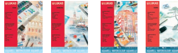
Studienqualität: ROMA und HAMBURG

Aquarell malt man in der Regel auf speziellen Papieren. Es gibt eine breite Auswahl solcher Aquarellpapiere, die sich sowohl durch die verwendeten Rohstoffe als auch in Flächengewicht und Oberflächenstruktur unterscheiden. So umfasst das exklusive LUKAS Malpapierprogramm derzeit 4 unterschiedliche Aquarell-Papiere, die in verschiedenen Blockformaten lieferbar sind.